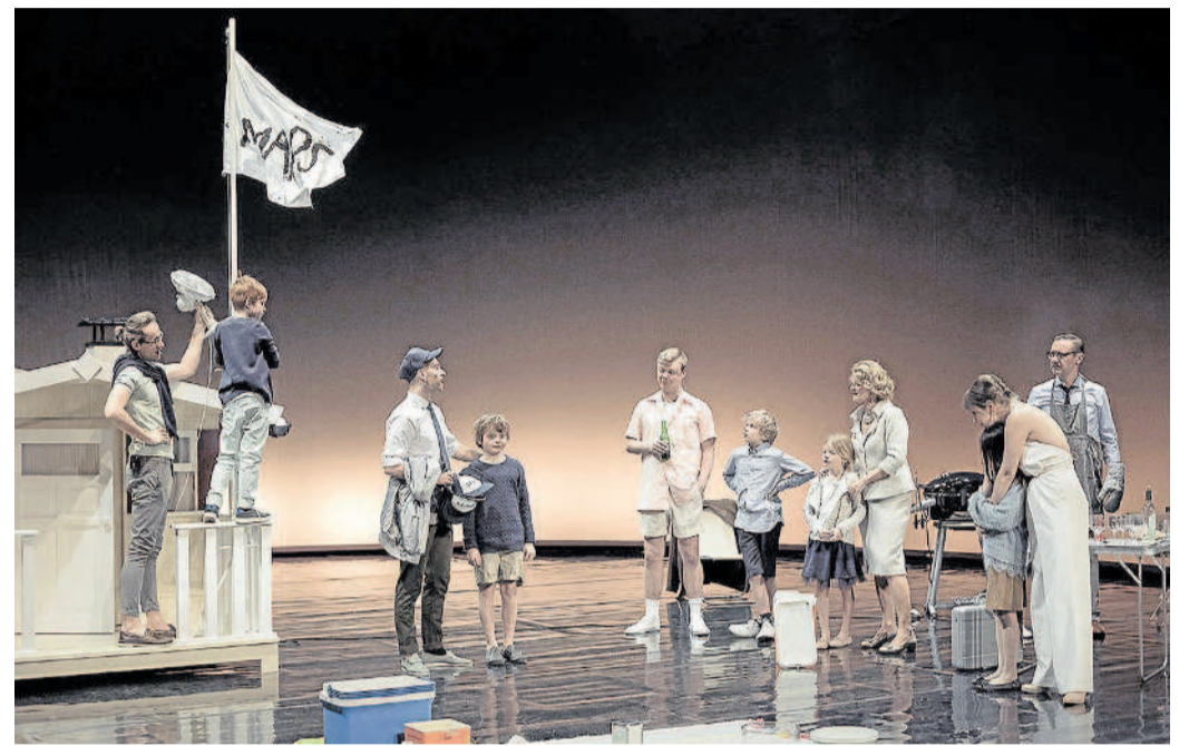
ZAHRADNÍ SLAVNOST. Při slavnosti se ukáže pravá podstata charakterů.

ostatních. V závěru inscenace vypadá, že přijde jakési rozhršení v podobě tvrzení, že nejlepší je žít v klidu a nevymýšlet pořád nějaké nové pořádky. A stejně se nakonec představitel selského, u nás tedy texaského rozumu brzy znemožní. Nikdo se svou vizí budoucnosti neuspěje, protože naše doba je složitá, tekutá, nepředvídatelná.“